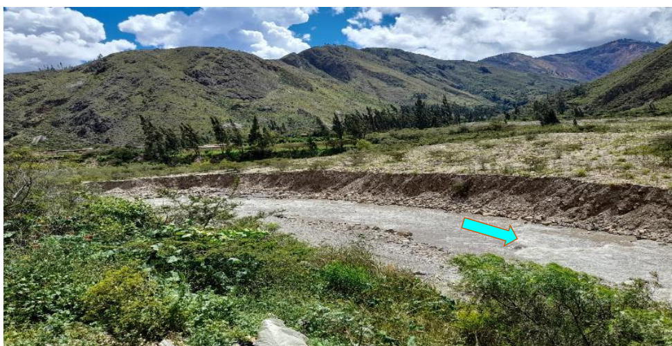
FIGURA N°02: SE VISUALIZA QUE REQUIERE DE MANTENIMIENTO Y PROTECCION ANTE LA EROSION DE LA MARGEN IZQUIERDA EN EL SECTOR EL PALLAR DEL RIO CHUSGON