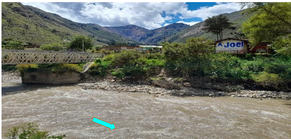
FIGURA N°01: TRAMO CRÍTICO EN EL RIO CHUSGON SECTOR EL PALLAR SE APRECIA AGUAS ABAJO LA NECESIDAD DE ENROCADO EN LA MARGEN IZQUIERDA