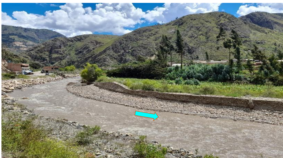
FIGURA N°03: SE OBSERVA LA MARGEN IZQUIERDA EROSIONADA EN EL SECTOR EL PALLAR DEL RIO CHUSGON